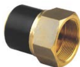
Adaptor PE / mosiądz z gwintem wewnętrznym PE 100 SDR 11 (ISO S5) 10 bar gaz / 16 bar woda