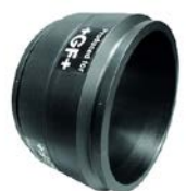
Elektromufa PE 100 SDR 11 (ISO S8)