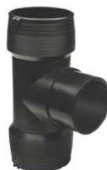
Elektrotrójnik 90° równoprzelotowy bez zacisków montażowych PE 100 SDR 11 (ISO S5)