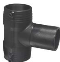
Elektrotrójnik 90° równoprzelotowy bez zacisków montażowych PE 100 SDR 11 (ISO S5)