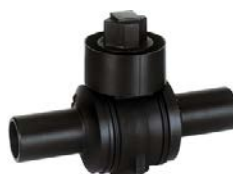
Zawór kulowy PE z pełnym przelotem PE 100 SDR 11 (ISO S5) 10 bar gaz / 16 bar woda

Średnica przelotu – do sprawdzenia w katalogu