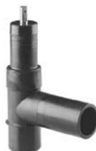
Zawór kątowy z frezem