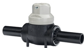
Zawór kulowy PE PE 100 SDR 11 (ISO S5) 10 bar gaz / 16 bar woda