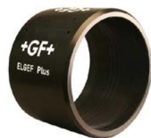
Elektromufa PE 100 SDR 11 (ISO S8)