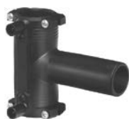
Elektrotrójnik 90° równoprzelotowy z zaciskami montażowymi PE 100 SDR 11 (ISO S5)