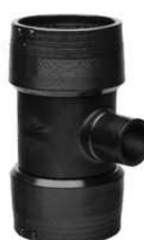
Elektrotrójnik 90° redukcyjny bez zacisków montażowych PE 100 SDR 11 (ISO S5)