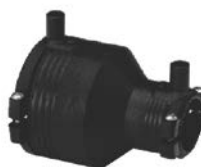
Elektroredukcja z zaciskami montażowymi