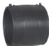
Elektromufa PE 100 SDR 11 (ISO S5)