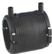
Elektromufa z zaciskami montażowymi PE 100 SDR 11 (ISO S5)