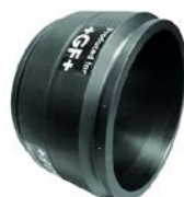
Elektromufa PE 100 SDR 26 (ISO S12,5)