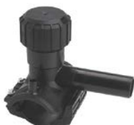
Obejma do nawiercania z dolną częścią montażową

Dla rur DN 280÷400 SDR 11 i rur DN 355÷400 SDR 17 ograniczenia w stosowaniu z nawiertkami i zaworami kątowymi z frezem (sprawdzić w katalogu +GF+).