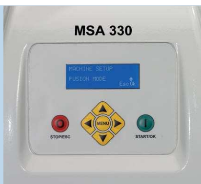
Łatwe w obsłudze menu