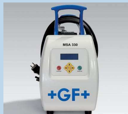
Zaprojektowana w oparciu o doświadczenie