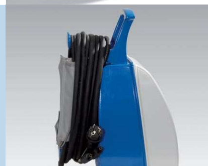
Poręczny uchwyt i możliwość zwinięcia przewodów

Protokoły zgrzewów zapisywane są w formacie PDF lub CSV; zarządzanie nimi odbywa się za pomocą standardowego oprogramowania. Na protokole zgrzewów znajduje się około 20 różnych informacji dotyczących parametrów zgrzewu i jego przebiegu. MSA 340 dodatkowo pozwala na rozszerzenie protokołu o współrzędne GPS umożliwiające lokalizację miejsca zgrzewania. (np. Google Earth), oraz kodów identyfikacyjnych materiałów użytych do budowy danego rurociągu (ISO).