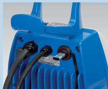
Port USB do transferu protokołów, antena GPS